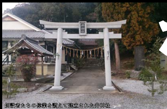
御殿者たちの偉業を覚えて建立された井神社