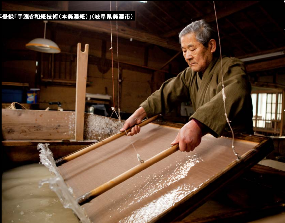
無形文化遺産2014年登録「手漉き和紙技術 (本美濃紙)」(岐阜県美濃市)