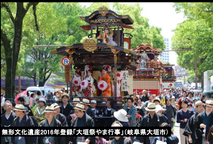
無形文化遺産2016年登録「大垣祭やま行事」(岐阜県大垣市)