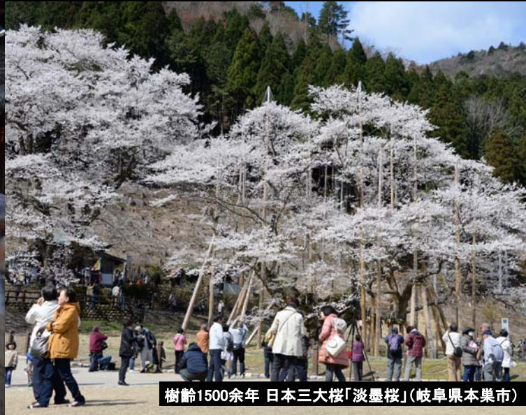
樹齢1500余年 日本三大桜「淡墨桜」(岐阜県本巣市)