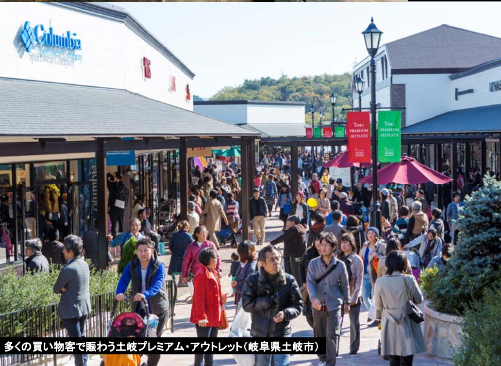
多くの買い物客で賑わう土岐プレミアム・アウトレット(岐阜県土岐市)