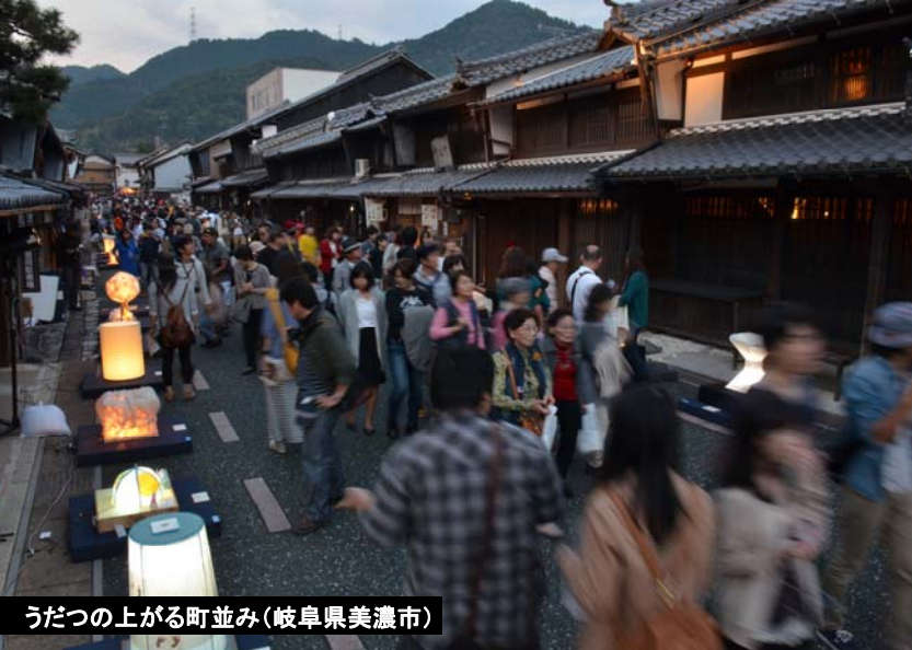
うだつの上がる町並み(岐阜県美濃市)