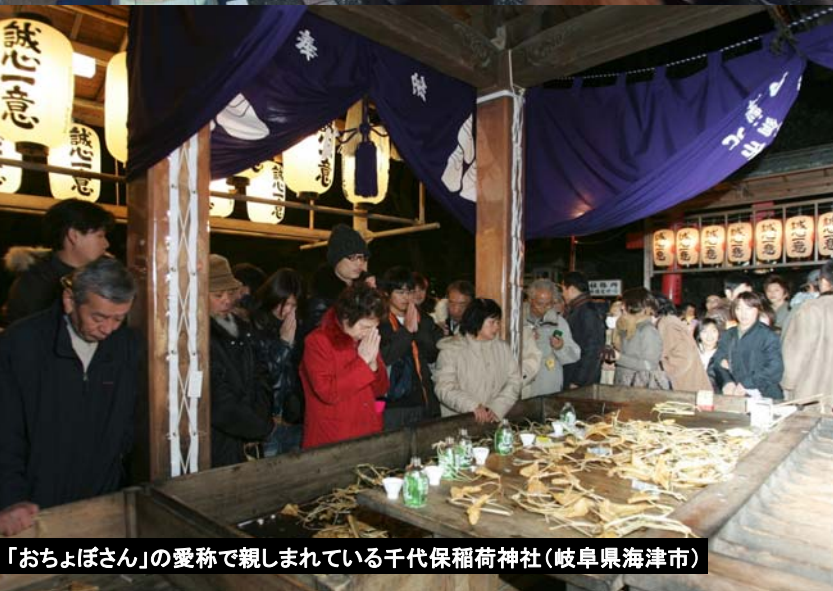
「おちよばさん」の愛称で親しまれている千代保稲荷神社(岐阜県海津市)