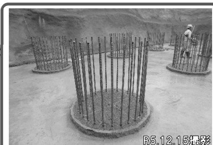
R5.12.15撮影 ①新A1橋台の基礎工事が完了し、橋台本体の施工に着手しています。