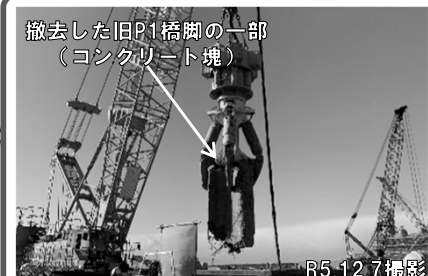
撤去した旧P1橋脚の一部（コンクリート塊） R5.12.7撮影 ⑤旧P1橋脚の撤去工事を行っています。