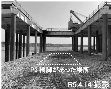
▼③旧 P3 橋脚