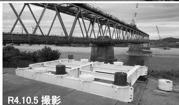
③仮栈橋の施工状況