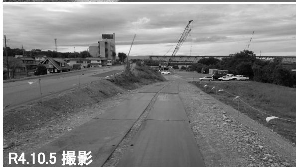
②進入路の整備完了