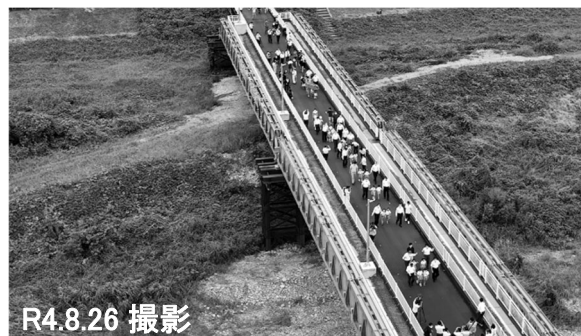
②歩行者用仮橋開通