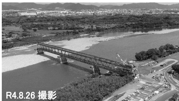
①車道桁撤去設備の設置状況