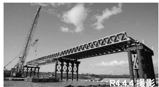
⑥ 応急組立橋の設置