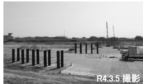
②仮橋の支持杭打ち込み