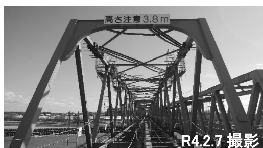
【②】コンクリート床版の撤去