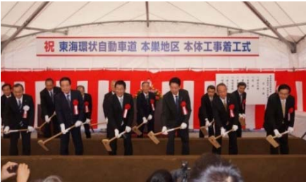
平成26年10月に岐阜県本巣地区の本体工事着工式が行われました。