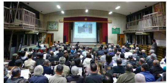
設計図による計画説明会