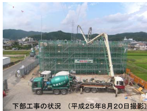
下部工事の状況 (平成25年8月20日撮影)