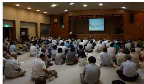
設計図による計画説明会 (平成25年7月31日 岐阜市黒野・方県地区)