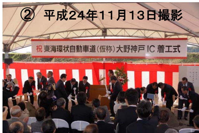
(大野・神戸IC)着工式