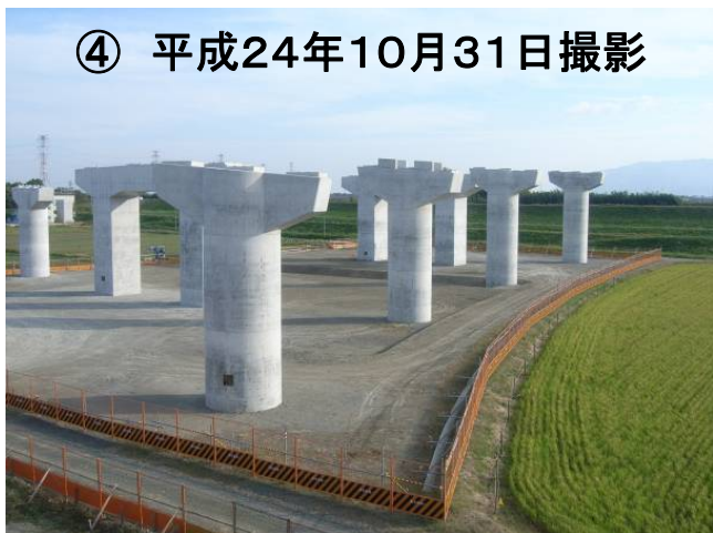
養老JCT周辺、養老IC方面を望む