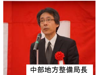
中部地方整備局長