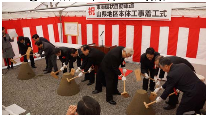
山県地区本体工事着工式「鍬(くわ)入れ」