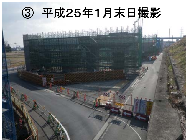
大垣市(福田)周辺、大垣西IC方面を望む