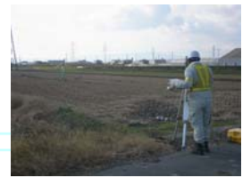
用地幅杭設置の状況