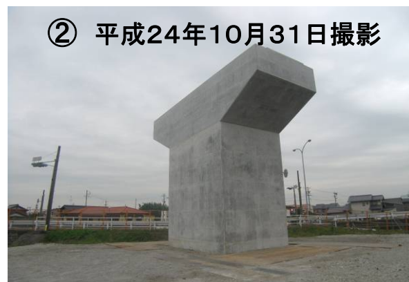
大垣市(赤坂)周辺、南東方面を望む