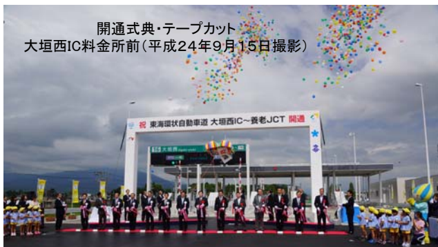
開通式典・テープカット 大垣西IC料金所前(平成24年9月15日撮影)