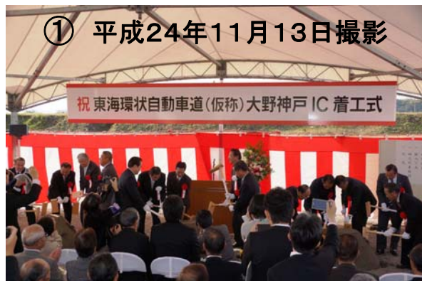
(大野・神戸IC)着工式