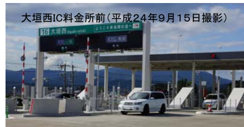
大垣西IC料金所前(平成24年9月15日撮影)