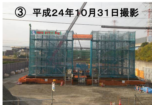
大垣市(熊野)周辺、大垣西IC方面を望む