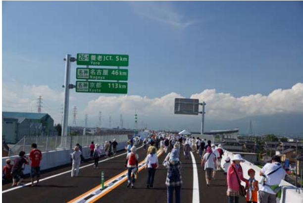
ウォーキング・本線(検町)から南方面を望む (平成24年8月25日撮影)