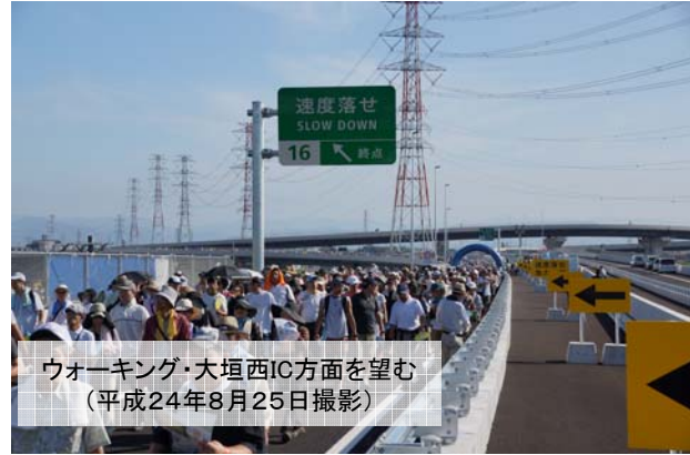
ウォーキング・大垣西IC方面を望む (平成24年8月25日撮影)