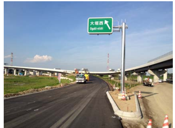
(養老JCT)の状況、東方面を望む (平成24年7月17日撮影)