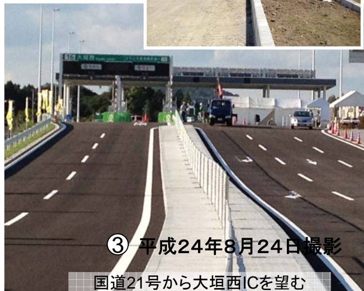
国道21号から大垣西ICを望む