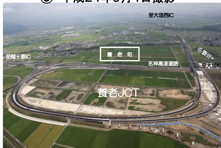
養老JCT周辺、北方面を望む