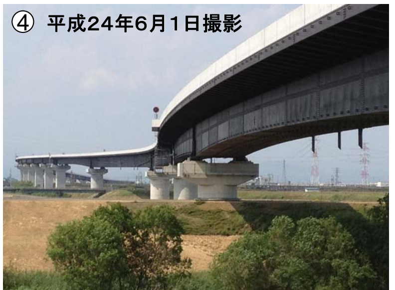
養老町から北方面を望む(泥川右岸側より)