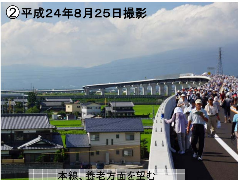
本線、養老方面を望む