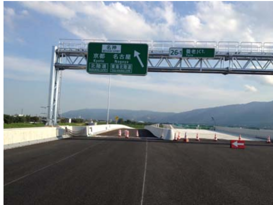
(養老JCT)の状況、南方面を望む (平成24年7月17日撮影)