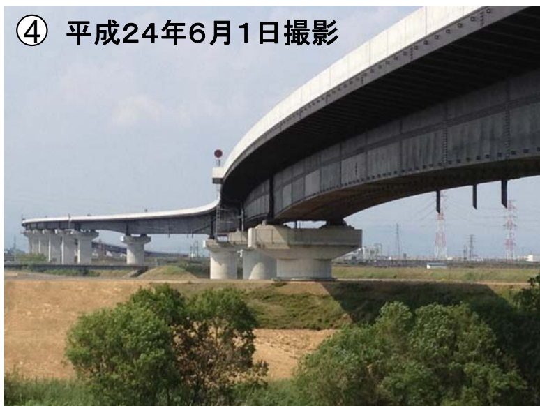
養老町から北方面を望む(泥川右岸側より)