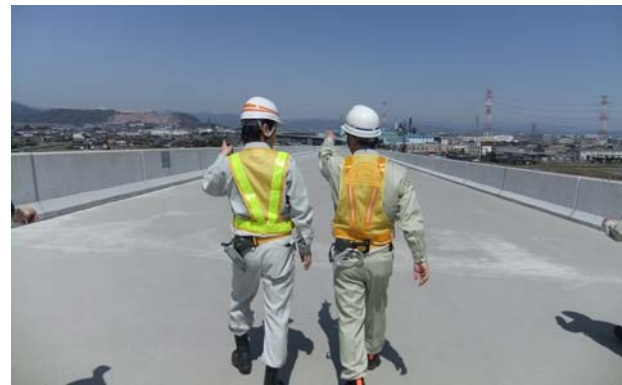
合同点検の状況、綾野地区の南から北を望む(平成24年3月29日撮影) (左側)山口日本高速道路(株)岐阜工事事務所長、(右側)福島岐阜国道事務所長