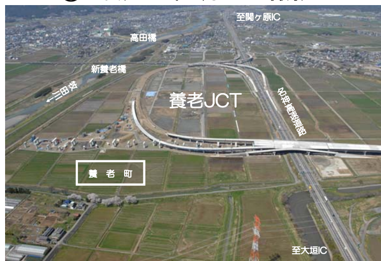
養老JCT周辺、東側から西方面を望む