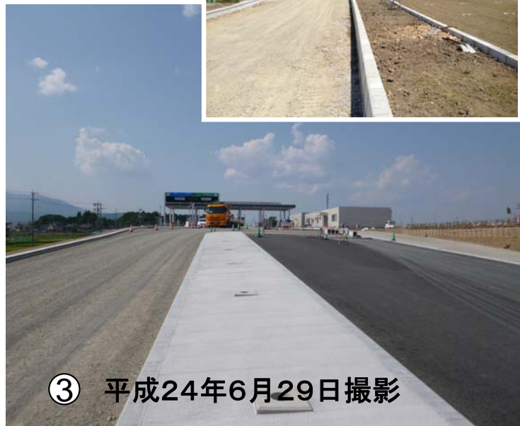
国道21号から大垣西ICを望む