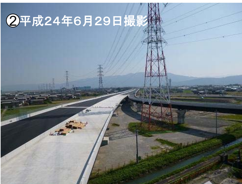
(大垣西IC)周辺、養老方面を望む