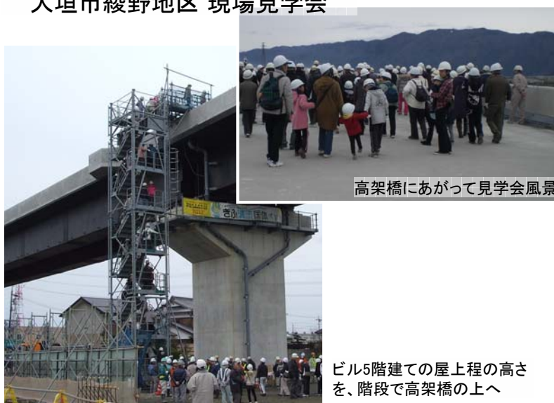
高架橋にあがって見学会風景