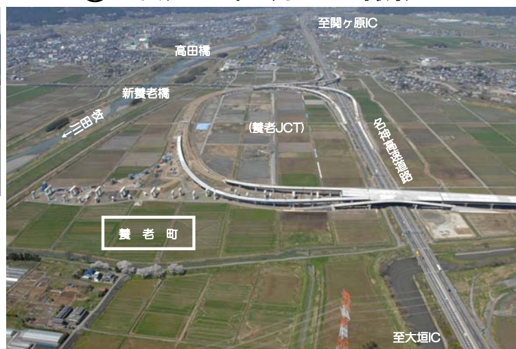
(養老JCT)周辺、東側から西方面を望む