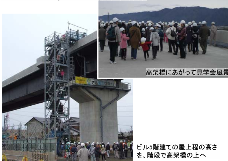
高架橋にあがって見学会風景