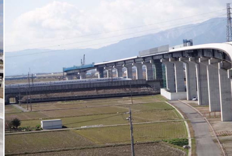
綾野地区から養老JCT方面を望む