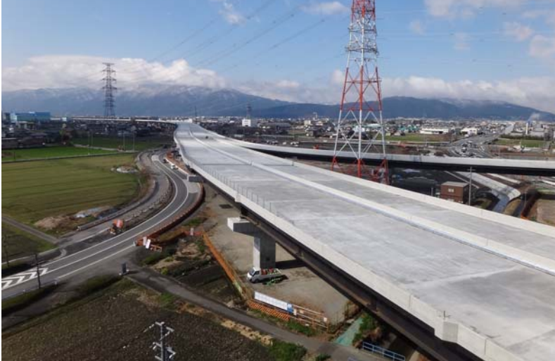
(大垣西IC)周辺、養老方面を望む