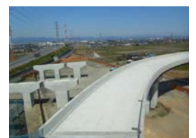
下部工工事の状況