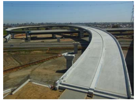
(大垣西IC)の状況、西から東を望む (平成24年3月末撮影)

橋梁工事完了。側道 整備等を工事中です。 NEXCO中日本で 本線の仕上げ工事を 実施中。