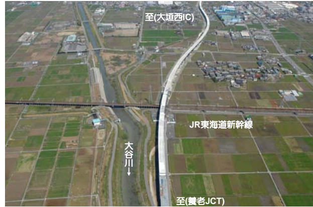
大垣市綾野地区の状況、南から北を望む (平成24年4月12日撮影)