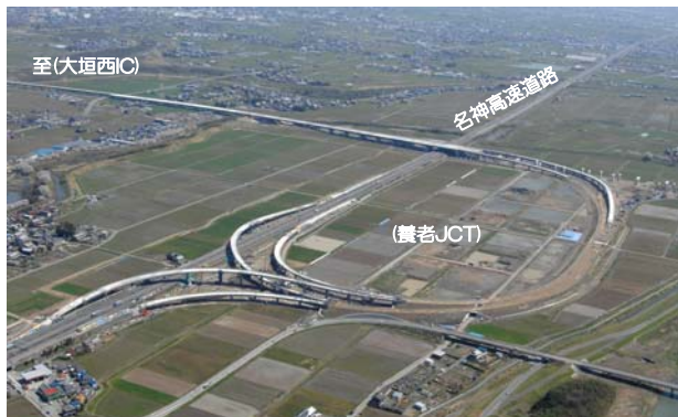
(養老JCT)の状況、南西から北東を望む (平成24年4月12日撮影)