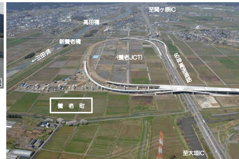
(養老JCT)周辺、東側から西方面を望む