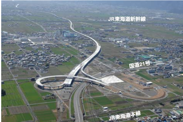
(大垣西IC)の状況、(大垣西IC)から(養老JCT)を望む (平成24年4月12日撮影)