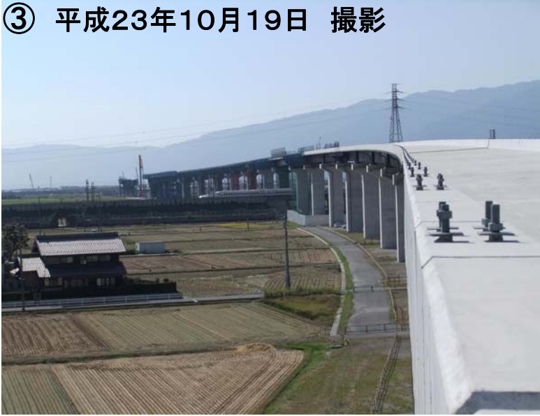
綾野地区から養老JCT方面を望む