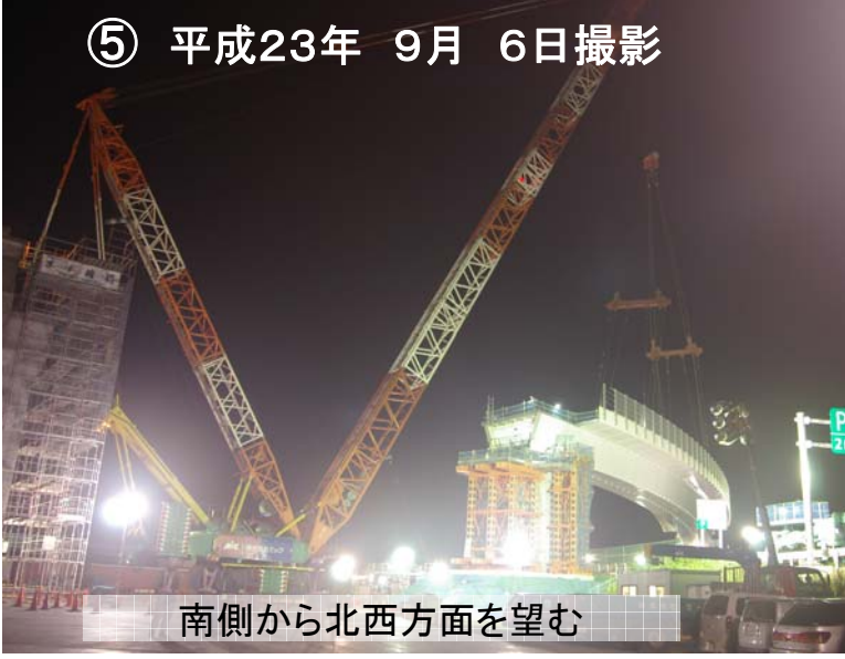
南側から北西方面を望む