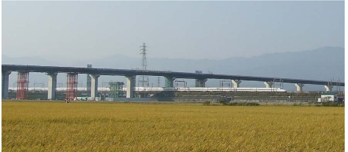
①大垣市綾野地区の工事状況(JR新幹線の南側から北西方向を望む、平成23年10月撮影)