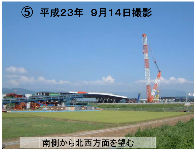
⑤ 平成23年 9月14日撮影