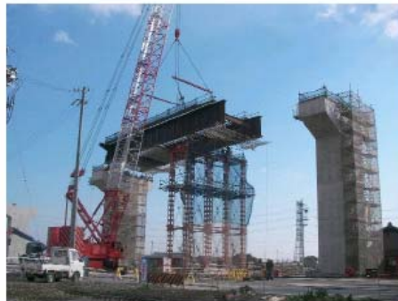
① 橋脚の上に橋桁を載せて、高架道路となります。(平成22年2月撮影)