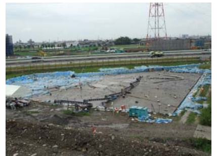
荒尾南遺跡(大垣市荒尾町・檢町) 『埋蔵文化財調査』 文化財保護法により埋蔵文化財調査(遺跡調査)を行っています。(平成22年6月撮影)