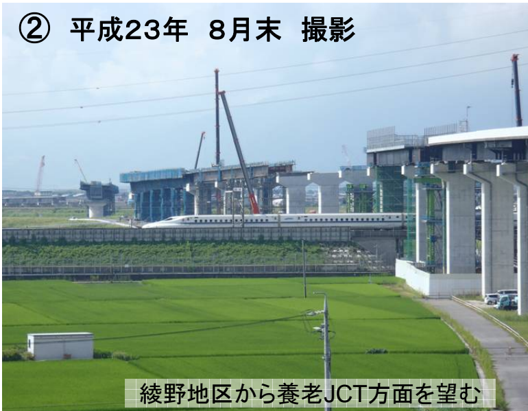
② 平成23年 8月末 撮影