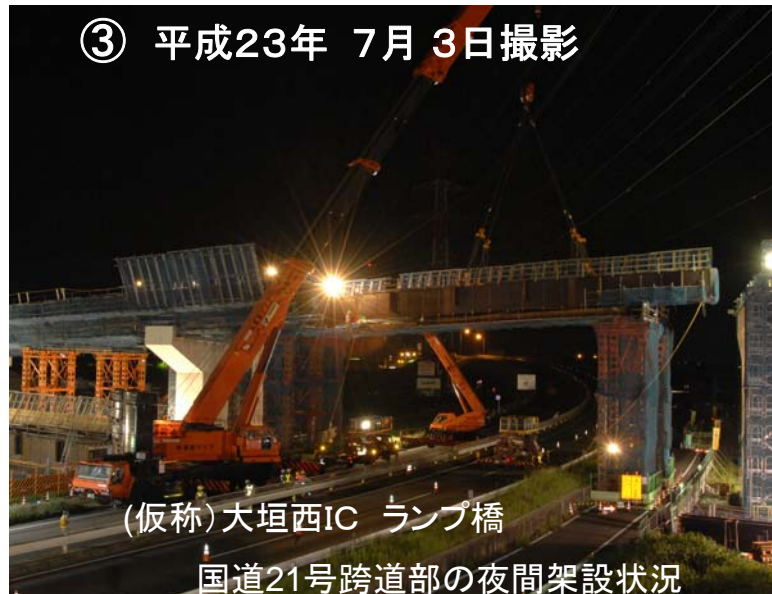
③ 平成23年 7月 3日撮影