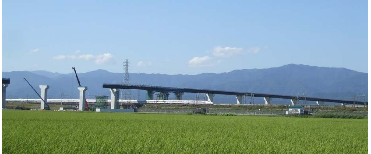
①大垣市綾野地区の工事状況(JR新幹線の南側から北西方向を望む、平成23年9月撮影)