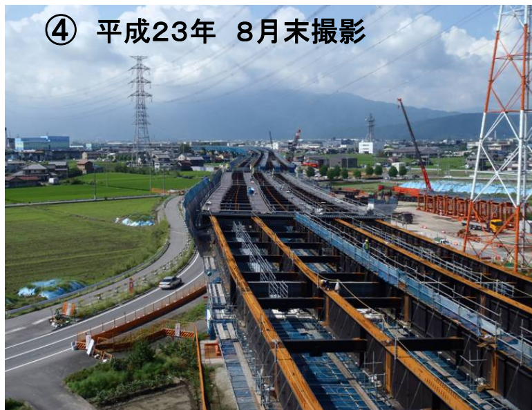
④ 平成23年 8月末撮影