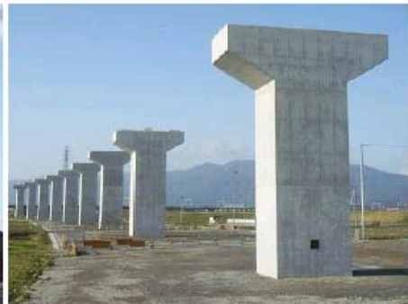
① 高架橋の橋脚が完成しました。(平成22年3月撮影)