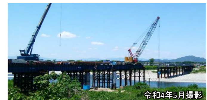
<右岸側> 応急組立橋の施工状況