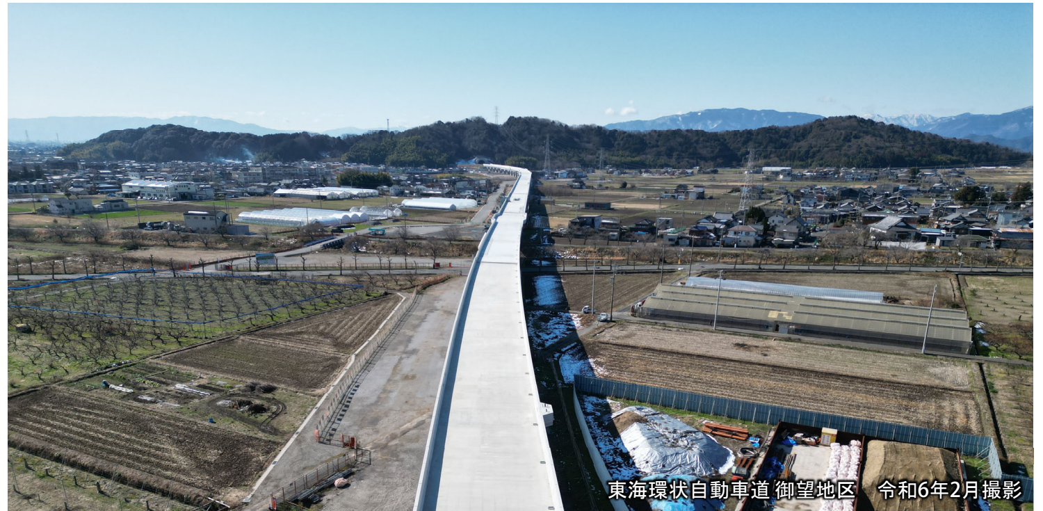
東海環状自動車道 御望地区 令和6年2月撮影