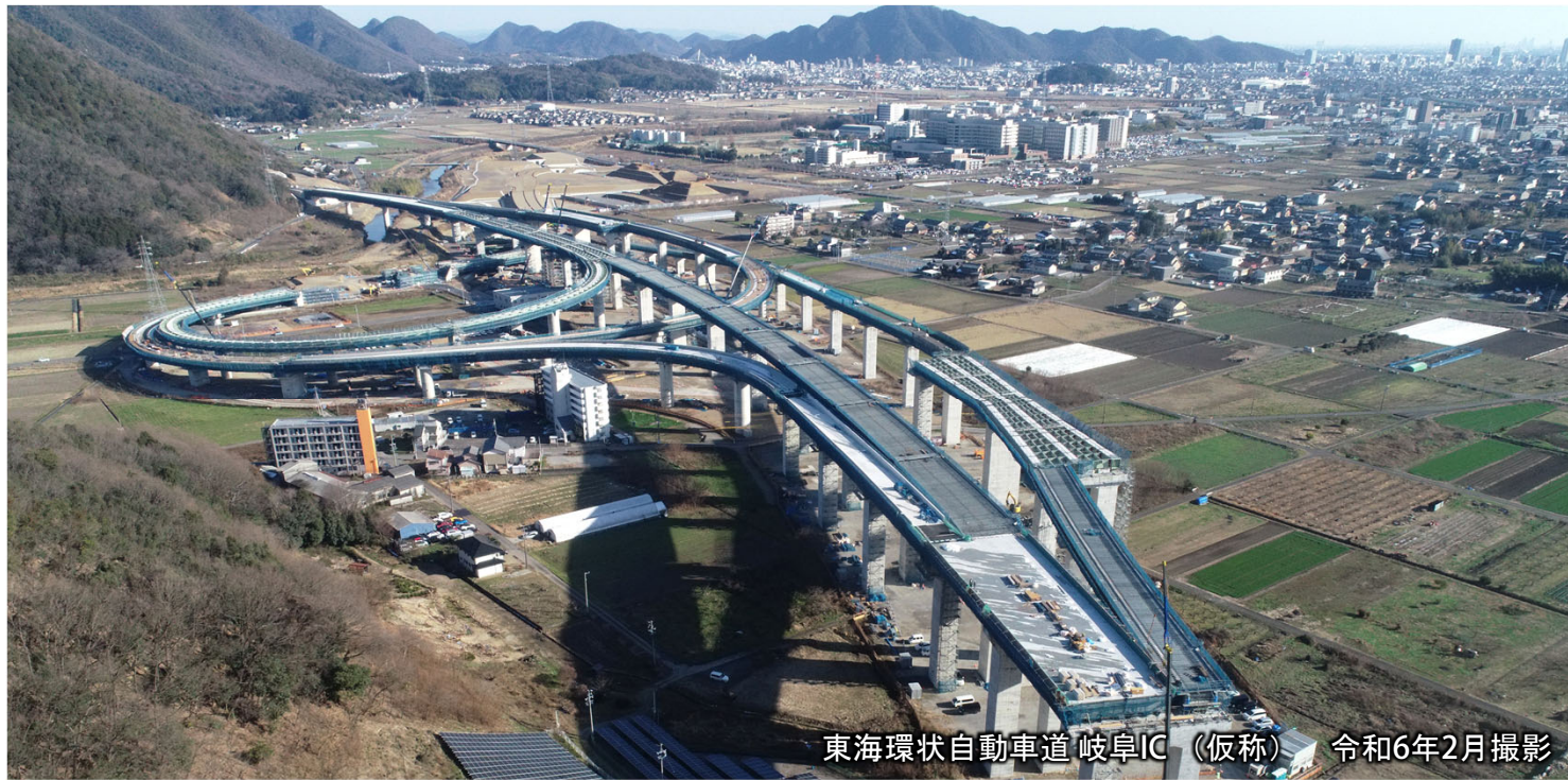
東海環状自動車道 岐阜IC (仮称) 令和6年2月撮影