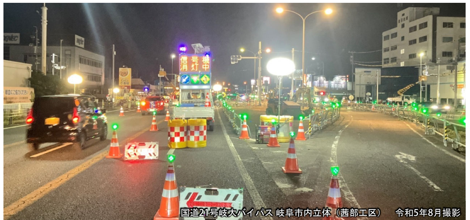
国道21号岐大バイパス 岐阜市内立体 (茜部工区) 令和5年8月撮影