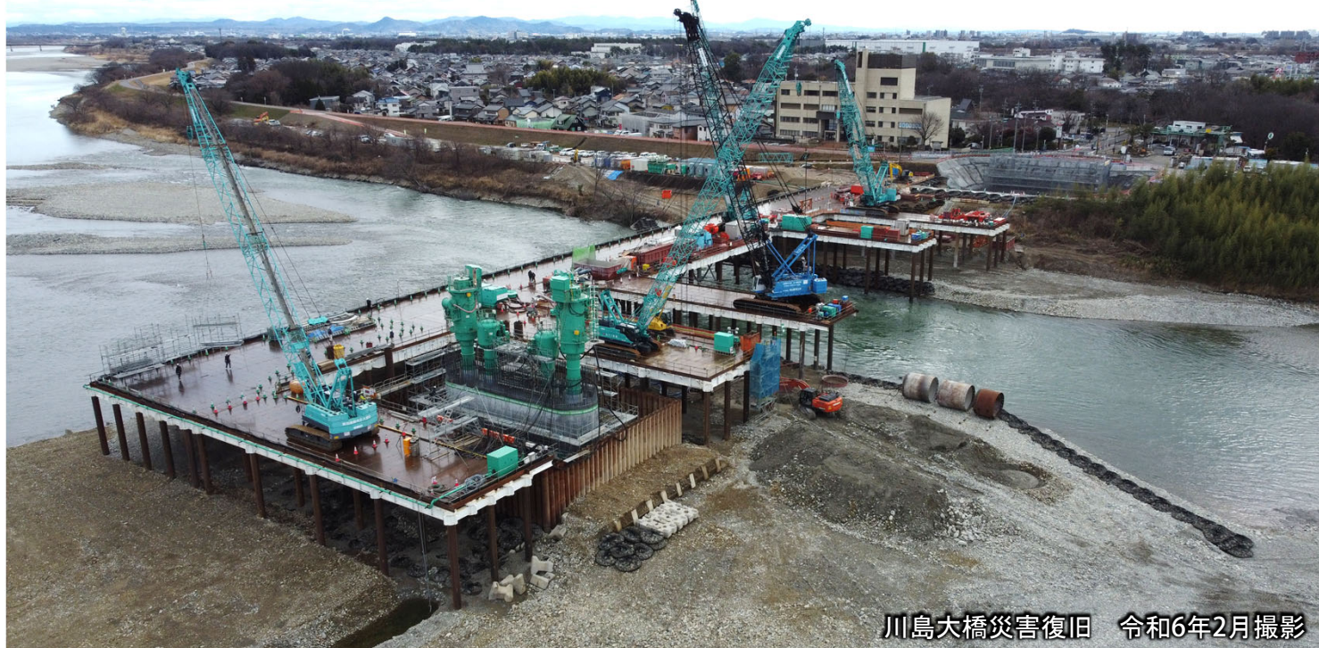
川島大橋災害復旧 令和6年2月撮影