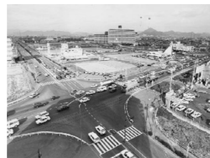
S 59 21号岐大バイパス藪田地区

41号七宗第4トンネル工事着手。 21号太田橋架替工事及び41号七宗第四トンネル工事に着手。 156号岐阜東バイパスの国鉄立体化事業完成、岐南インター～岐阜市東興町まで2車線で開通。 258号大垣局改用地買収完了。