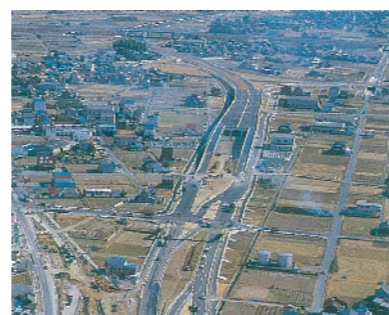
S 60 21号那加バイパス完成

21号太田橋関連として今渡地区で供用。 41号美濃加茂バイパス太田高架橋等工事着手。 156号岐阜東バイパス2工区で用地買収本格化。 交通安全施設事業着々と整備。