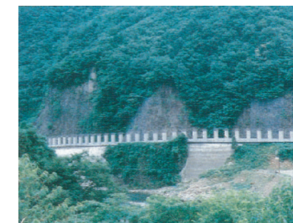
S 57 156号美並村稲成洞門着工

21号岐大バイパス徳田地区 L = 1.2 km 4/6車線事業完成。 156号岐南町八剣地区より岐阜市東興町まで L = 2.6 km が直轄管理区間に指定。