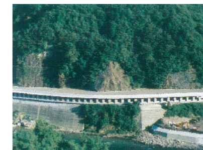
S 58 156号美並村稲成洞門完成

21号那加バイパスの一部が2車線で供用開通。 156号大和町剣地区より白鳥町向小駄良地区まで L = 6.2 km が直轄管理区間に指定。 41号美濃加茂バイパス用地買収継続。 七宗第4トンネル完成。 258号大垣局改開通。 金山町に41号雪寒基地を開設。