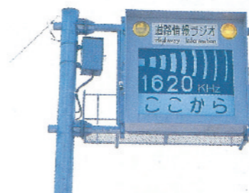
S 61 道路情報ラジオ開始

21号那加バイパスL = 2.4km2/6車線完成とともに東海北陸自動車道(岐阜～美濃)も同時開通。 156号岐阜東バイパス日野地区で遺跡発掘調査。 修繕事業で橋梁補修事業を4ヶ所実施。