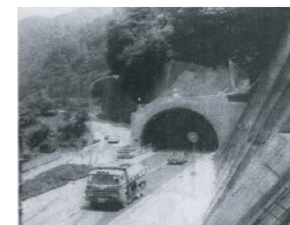
156号吉野トンネル開通

21号岐大バイパス新揖斐川橋を含むL = 2.2kmを4/6で完成。 道路情報ラジオ放送開始(21号大垣市)。 大規模特殊事業調査として東海環状自動車道、関・土岐間を実施。