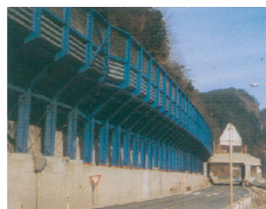
S 55 41号白川町油井イ型シェッド完成

岐阜国道工事事務所開設20周年記念式典開催。 21号岐大バイパス下川手地区の4/6車線事業完成。 21号関ヶ原バイパス等2工区を事業化。 156号岐阜東バイパスの名鉄立体化事業完成。