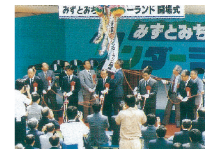
S 63 ぎふ中部未来博に参加

岐阜国道広報100号発刊。 可児局改多治見工事から管理引継。 156号吉野トンネル開通。 156号岐阜東バイパス第2工区着工(岩戸トンネル、岩戸高架橋)。 道路情報提供装置の積極的整備。