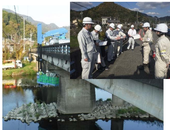
橋梁点検車の試乗体験