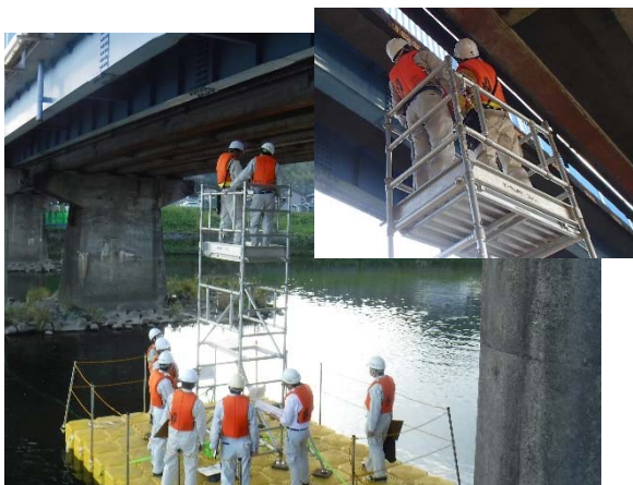
フロート台船+ローリングタワーの試乗体験 桁下等の診断講習