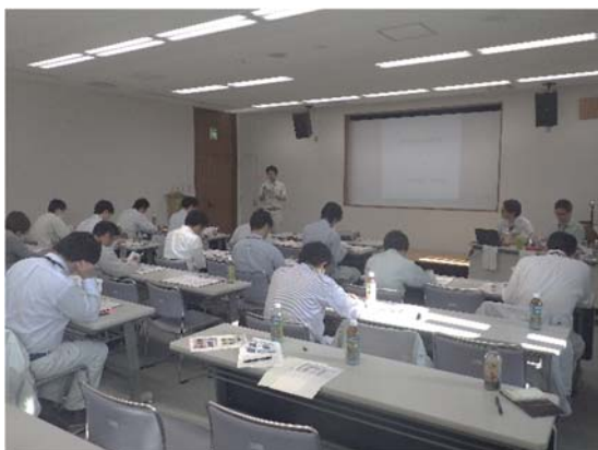
橋の劣化・損傷のメカニズムに関する講習