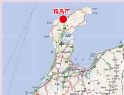
地理院地図に加筆

富士砂防事務所は、中部地方整備局の第1陣と第3陣で派遣され、それぞれ1月3日～9日、1月17日～23日に、石川県の輪島市で現地調査しました。