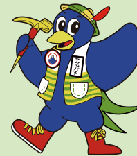
富士砂防事務所 マスコットキャラクター 「アマツバメ」