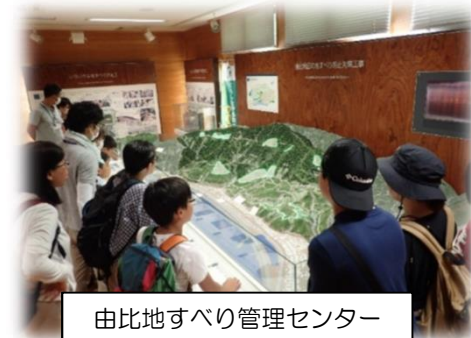
由比地すべり管理センター

開催日時 7月21日(日) 13時から16時30分 集合場所 清水興津生涯学習交流館(図書館) ※駐車場利用可能・現場等移動は貸切バス使用 募集人員 40名程度(先着20組) 定員になり次第締め切り 参加費用 100円/人(保険料) 注意事項 ★工事現場の見学のため、安全を考慮し1組につき大人1名(静岡市在住または在勤)の参加をお願いします★動きやすく汚れても良い服装でお願いします。(スカート、ハイヒール、サンダル、クロックス不可) ★大雨または暴風警報が発表された場合、または荒天が予想される場合は中止とし、静岡市から連絡します。