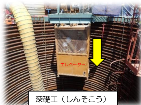
深礎工(しんそこう)