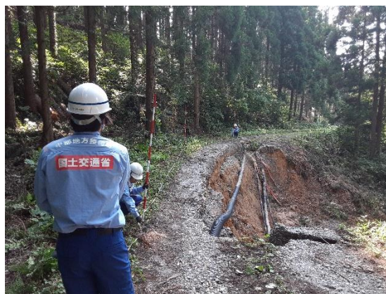
山形県庄内町三ヶ沢 被災状況の調査