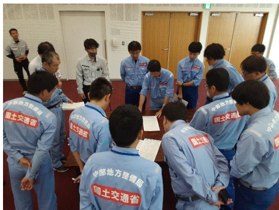
庄内町役場 被災状況調査に関する事前打合せ

富士砂防事務所は東北地方の大雨による災害支援のため、TEC-FORCEを派遣し、山形県庄内町で被災状況の調査活動を行っています。