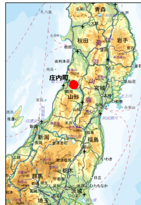
被災状況調査位置図