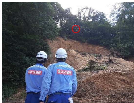
庄内町清川新町 ドローンによる被災状況の調査