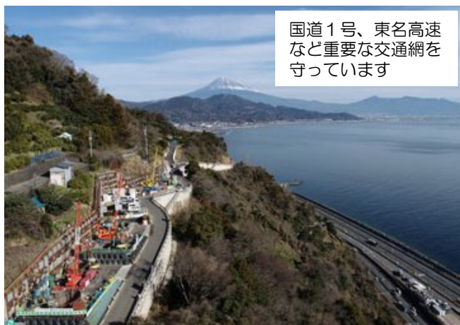
国道1号、東名高速など重要な交通網を守っています