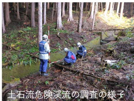
土石流危険溪流の調査の様子