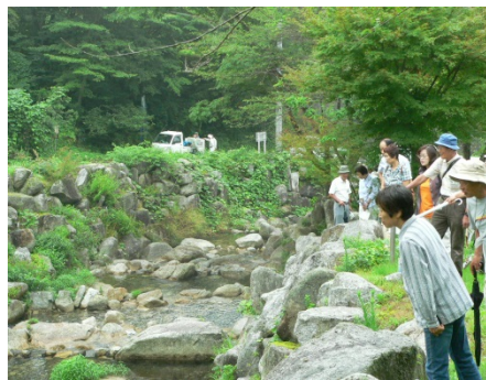
＜貝月谷溪流保全工＞

●第2回里山探検隊を実施しました。貝月谷溪流保全工、瀬戸谷第1砂防堰堤(鉄製透過型堰堤)、大蔵谷第1砂防堰堤の工事現場、山の谷第1砂防堰堤において「呼び水式サイフォン排水装置」「サイフォン式小水力発電」の開発実験を見学しました。もろかの里での工芸体験のほか、「徳山ダム」において作業船に乗船してのダム湖、ダム内部の見学を行いました。砂防事業では、土砂災害から地域の安全・安心を確保するだけでなく、工事現場などでは様々な工夫や開発が行われていることや揖斐川流域における徳山ダムの役割を理解していただきました。