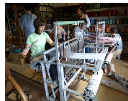
＜もろかの里工芸体験＞