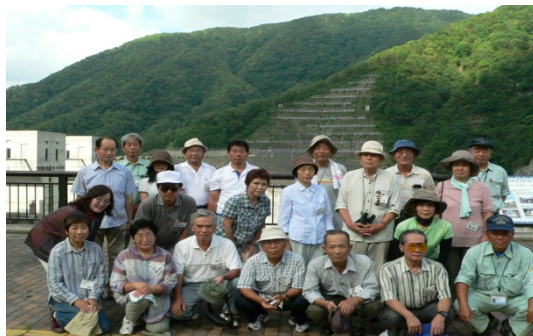
＜第2回 里山探検隊員＞