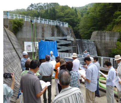
＜山の谷第1砂防堰堤＞