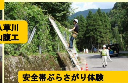
安全帯ぶらさがり体験