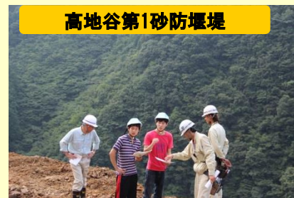
高地谷第1砂防堰堤