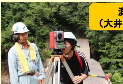
測量体験 (大井谷第1砂防堰堤)