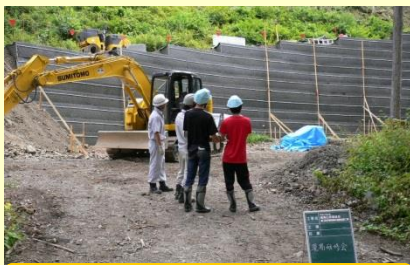
越波谷第3砂防堰堤