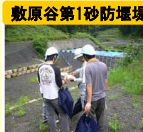
敷原谷第1砂防堰堤