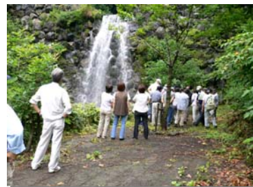
●下辻谷第2砂防えん堤見学

午前中に、揖斐郡森林組合の木材破砕場及び木質ボード工場を見学し、間伐材の利用やチップ材等の資源循環について説明を受けました。その後、横山ダム(中空重力式ダム)のさまざまな施設を見学していただきました。午後からは、流木アートに挑戦。横山ダム(奥いび湖)の流木を利用し、試行錯誤しながらアート作品を熱心に作っていただきました。