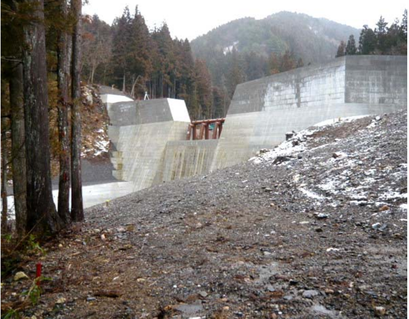
完成した門脇谷第1砂防えん堤工事(本巣市根尾下大須地先)

発行/平成21年3月24日 発行所/★国土交通省 中部地方整備局 越美山系砂防事務所 〒501-0605 岐阜県揖斐郡揖斐川町極楽寺137 Tel.0585(22)2161 Fax.0585(22)2174 (ホームページ)http://www.cbr.mlit.go.jp/etsumi/ (e-mailアドレス)etsumi@cbr.mlit.go.jp