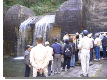
●鷲巣谷第1砂防えん堤