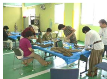
●流木アートに挑戦!!

揖斐川の上流には1,300年の時を越えて今に語り継がれている夜叉ヶ池伝説がありますが、夜叉ヶ池の里(川上)にあります夜叉龍神社、夜叉龍神ゆかりの寺長昌寺等歴史について坂内振興事務所より説明していただき、また、砂防施設見学としてナンノ谷床固工群、赤岩第1砂防えん堤、坂内砂防えん堤に取り付けられている魚道を見学しました。また、坂内民族資料館では、地元の方との交流もあり、会員のみなさんも喜んでいただけました。