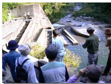
●坂内砂防えん堤の魚道見学