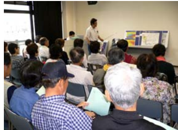
●徳山ダム・徳山会館見学

揖斐川町久瀬小津の白山神社では、地元の方の説明で、ほとんど室町期に作られた貴重な『お面』等を鑑賞させていただきました。午後からは下辻谷第2砂防えん堤、貝月谷第1砂防えん堤を見学し、記念にコンクリートで『手形』を取り、地域の歴史、文化に直接触れ、砂防施設の効果等についても学びました。