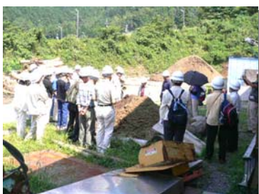
●揖斐郡森林組合の木材破砕場

午前中に、揖斐郡森林組合の木材破砕場及び木質ボード工場を見学し、間伐材の利用やチップ材等の資源循環について説明を受けました。その後、横山ダム(中空重力式ダム)のさまざまな施設を見学していただきました。午後からは、流木アートに挑戦。横山ダム(奥いび湖)の流木を利用し、試行錯誤しながらアート作品を熱心に作っていただきました。