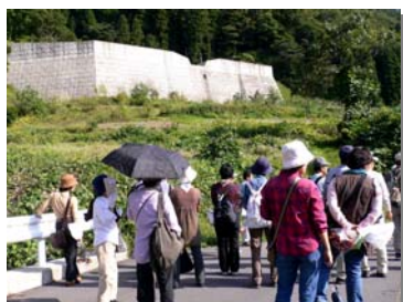
●赤岩第1砂防えん堤見学

揖斐川の上流には1,300年の時を越えて今に語り継がれている夜叉ヶ池伝説がありますが、夜叉ヶ池の里(川上)にあります夜叉龍神社、夜叉龍神ゆかりの寺長昌寺等歴史について坂内振興事務所より説明していただき、また、砂防施設見学としてナンノ谷床固工群、赤岩第1砂防えん堤、坂内砂防えん堤に取り付けられている魚道を見学しました。また、坂内民族資料館では、地元の方との交流もあり、会員のみなさんも喜んでいただけました。