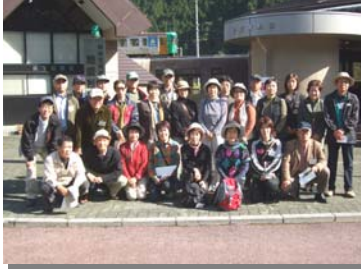
●根尾地震断層会館前で

午前中は根尾にある地震断層観察館(※)では、1891年の濃尾地震によってできた、断層を見学し、地元の方から災害当時のお話をお聞きし、午後は鷲巣谷第1砂防えん堤と上大須ダム(中部電力)を見学していただきました。 ※参加者費用負担