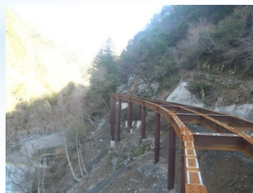
メルトド工法を見学 (大谷川)