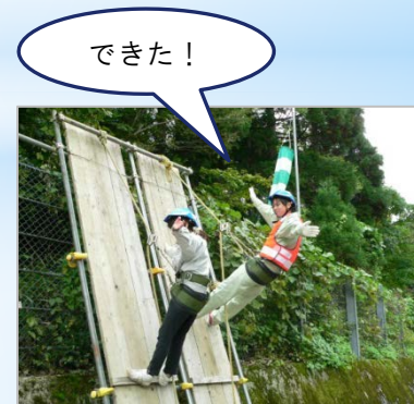
安全帯を使った作業を体験 (親綱ロリップの体験)