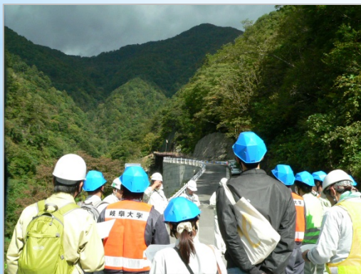
急傾斜面での道路工事 (大谷川)