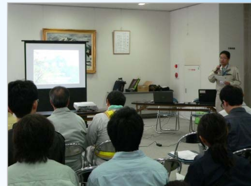
砂防事業の概要説明（出張所長）