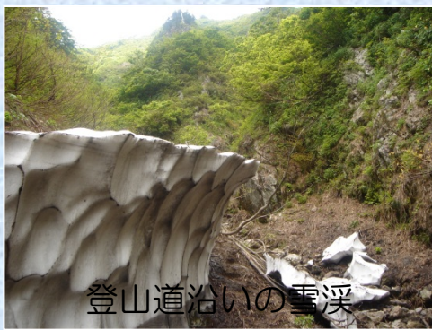
登山道沿いの雪渓