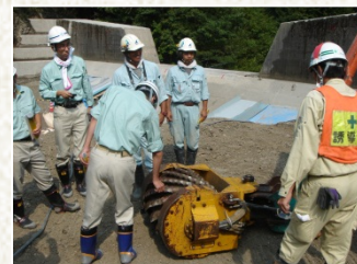
マシンを触って確認