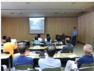
過去の災害事例紹介の模様

また、土砂災害危機時の情報収集源として、本巣市の防災行政無線戸別受信機や「ぎふ土砂災害警戒情報ポータル」「越美山系防災情報」等の各種ホームページ、ペットボトルを使った簡易雨量計等を紹介し、土砂災害危機時の積極的な活用をお願いします。