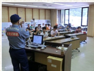
簡易雨量計の説明の模様