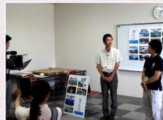
インタビューの模様

インタビューの様子は、9月16日から2週間「こちら本巣市情報局」内「防災のすゝめ」コーナーで放送予定です。