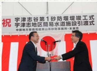
藤原市長への目録授与