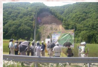
坂内川上崩壊地の見学