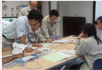
演習に参加する職員

演習の目的は防災体制の万全を期することです。演習では、土砂災害等が発生した時に行うべき内容を確認しながら進められました。今回の演習により、いざと言う時に対策が迅速に行えるよう、職員がそれぞれの役割分担等を再確認しました。