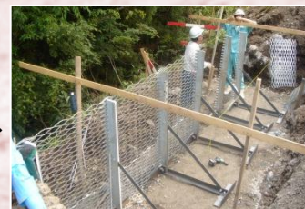
鋼製L型擁壁の組立状況

揖斐川町坂内坂本(さかうちさかもと)地先で工事を進める大仲津谷(おおなかつたに)第1砂防堰堤工事(施工:株山辰組)では、現在、工所用進入路となる現道拡幅を行っています。拡幅する箇所は作業スペースが狭くクレーン等が使用できません。そのため、鋼製L型擁壁工にて施工しています。本工法は、各部材がコンパクト・軽量で、人力により部材を持ち運び・組立ができるため、クレーンが入れない箇所でも容易に施工できる特徴があります。