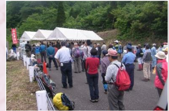
安全祈願祭の様相

揖斐川町坂内川上地先の登山道において、夜叉ヶ池(やしゃがいけ)の山開き安全祈願祭が6月2日に行われました。シーズンの無事を祈願した後、登山愛好家ら多数が夜叉ヶ池をめざしました。登山は例年11月末頃まで可能とのことでした。