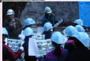
小学生の現場見学会(11月28日)