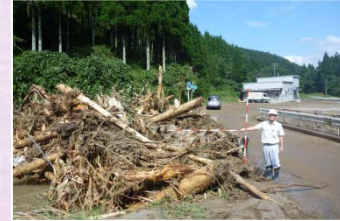
品又谷の流木災害