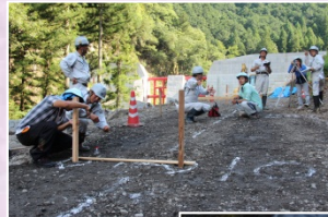
キャンプ砂防 in越美(8月)

外津汲内谷第1砂防堰堤工事で久瀬小学校5・6年生を対象に現場見学会を開催(11月28日)するなど、第9期山郷倶楽部、キャンプ砂防、建設ICT現場見学会、小水力発電見学会等々多数開催し、「砂防」に対する広報を進めています。