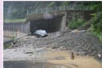
国道303号への土砂流出

9月17日から19日にかけて、台風16号や秋雨前線の影響で管内で600mmを超える豪雨を観測しました。この豪雨により揖斐川町坂内坂本(さかうちさかもと)地先の品又谷支川のギラ谷で土石流が発生し、品又谷へ流下した流木により橋梁が閉塞するなど、各地で土砂災害をもたらしました。