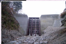
瀬戸谷第1砂防堰堤