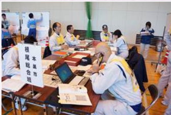
合同防災訓練(11月25日)

10月1日(月)に深層崩壊溪流(小流域)レベル評価区域図を公表しました。揖斐川上流域は、過去に「ナンノ谷の大崩壊地」等の深層崩壊による天然ダムの形成と、その決壊により多大な被害にみまわれた地域です。当事務所では、合同防災訓練や検知システム整備等を通じて、深層崩壊対策も取り組んでいきます。