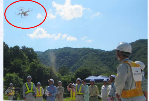
無人航空機操作訓練

本演習では、土砂災害が発生した際に迅速に被害を調査し、被害拡大の防止につなげるため、土砂災害を想定した情報伝達の確認と無人航空機による想定被害箇所状況把握のための撮影及び画像解析の現地演習・関係機関と連携を図ることが出来ました。