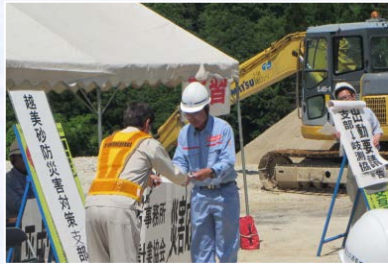
支部→岐測協へ出勤要請(演習)