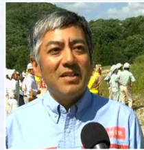
NHKによる、事務所長テレビ取材