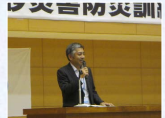
事務所長による講演