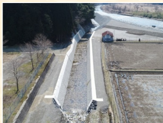
天神堂岡谷溪流保全工事