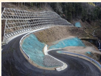
下谷第2砂防堰堤道路路工