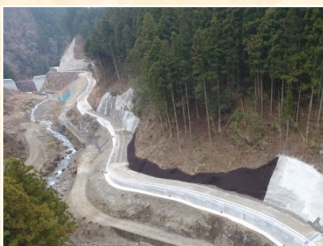
大蔵谷第1砂防堰堤道路路工