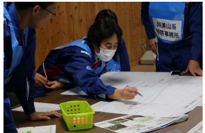
訓練実施状況のイメージ