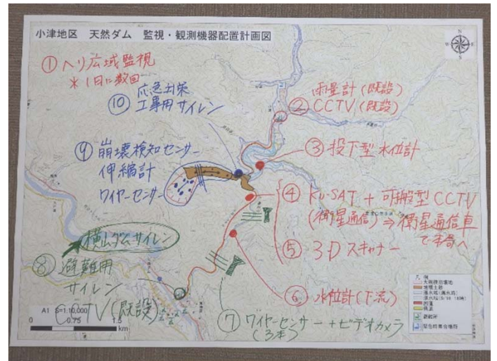
訓練成果のイメージ