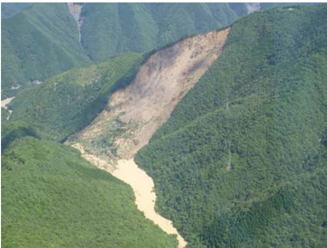
天然ダム形成イメージ