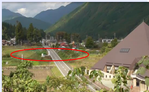
高台からの根尾谷断層見学