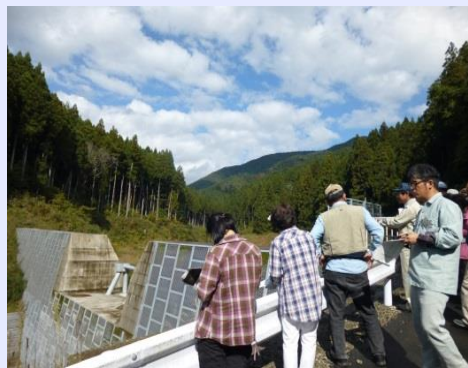
敷原谷第1砂防堰堤