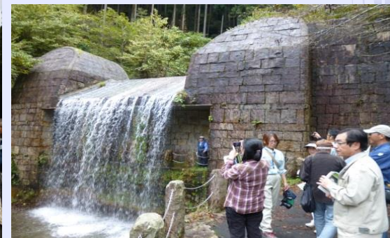
鷲巣谷第1砂防堰堤