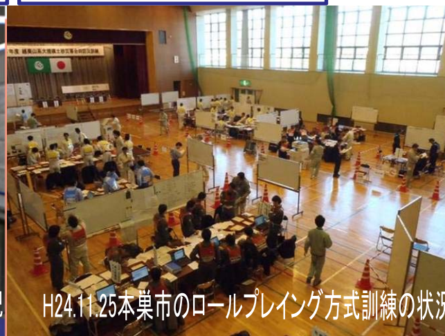
H24.11.25本巣市のロールプレイング方式訓練の状況