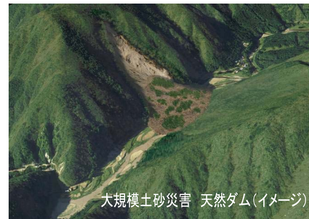
大規模土砂災害 天然ダム(イメージ)

大規模な土砂災害が発生した場合、その被害は甚大となり社会的な影響も大きく、市町村単独あるいは都道府県単独での対応が困難な状況となる場合が想定されます。そのため土砂災害発生時には、関係機関が実施すべき対応を互いが十分把握し、早期に連携を図りながら効果的・効率的に対応していく必要があります。本マニュアルは、国土交通省、岐阜県、本巣市、揖斐川町等の各機関が連携して対応するための基本的事項を取りまとめています。マニュアルは事務所HP ( http://www.cbr.mlit.go.jp/etsumi/info/info.html ) より閲覧できます。