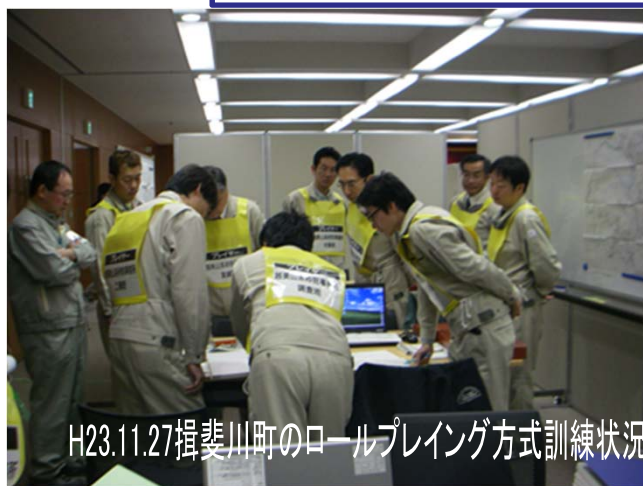
H23.11.27揖斐川町のロールプレイング方式訓練状況