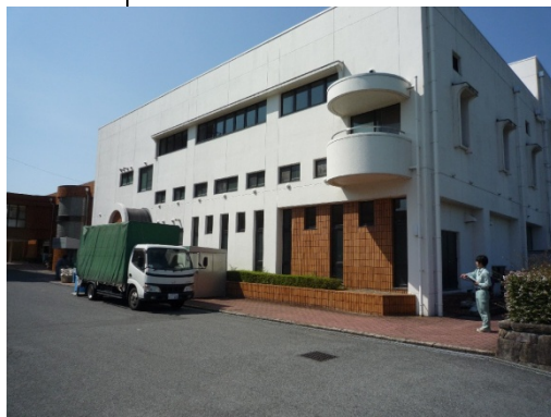
本巣体育センター

※本巣市役所の駐車場がありますが、お車でお越しの際は極力お乗り合わせをお願いいたします。