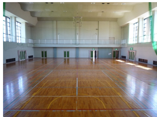
アリーナ（訓練会場）