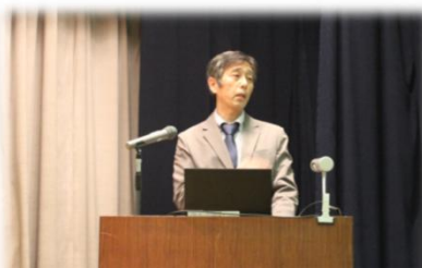
越美山系砂防事務所 榎野事務所長