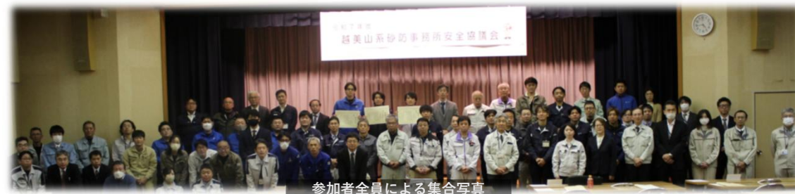
参加者全員による集合写真