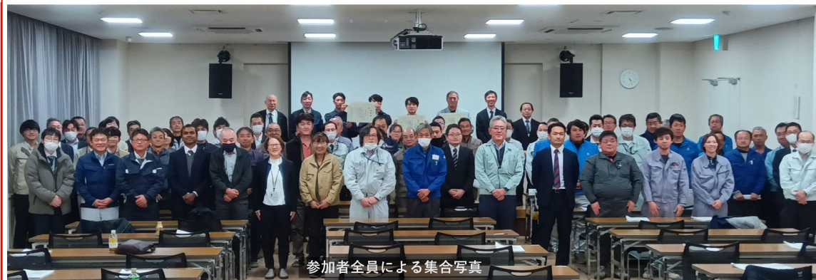
参加者全員による集合写真