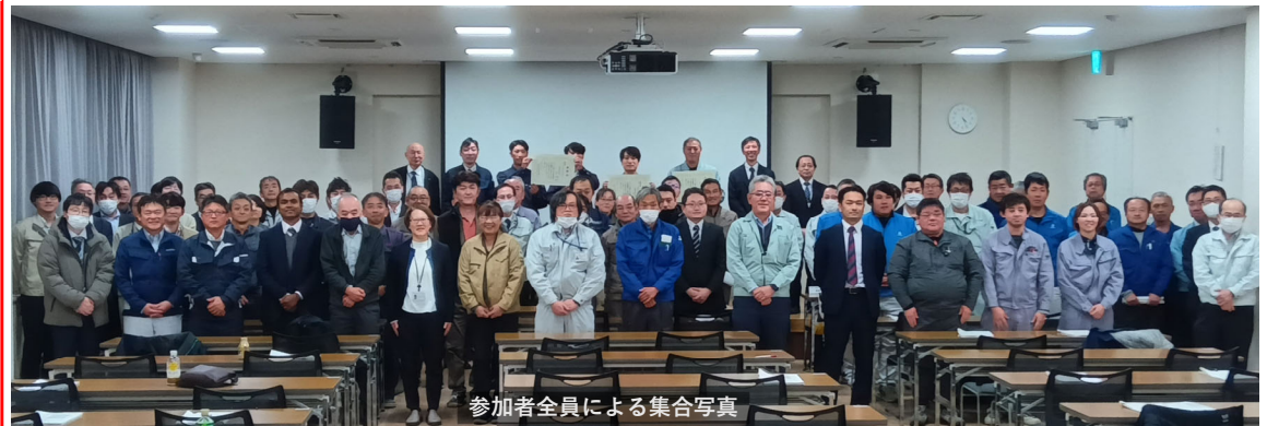
参加者全員による集合写真