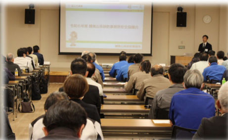
越美山系砂防事務所 樫野事務所長