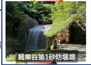
鷺巣谷第1砂防堰堤