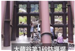
大蔵谷第1砂防堰堤