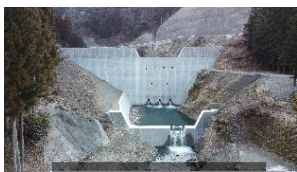
高地谷第1砂防堰堤