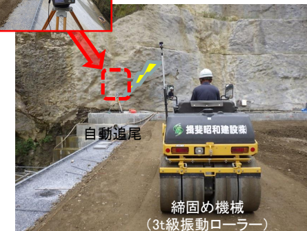
締め固め管理状況