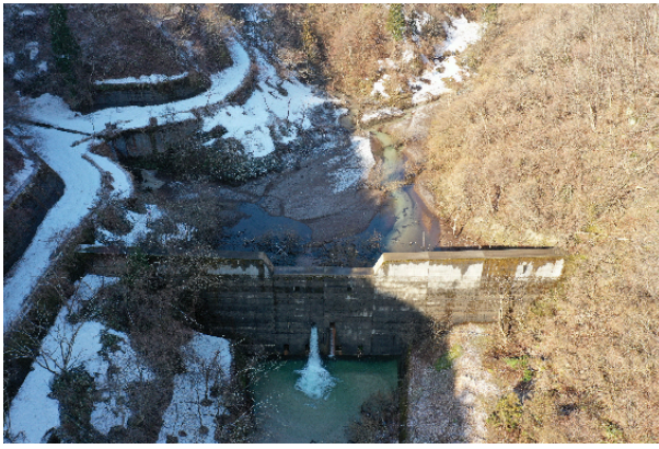
殿又谷第2砂防堰堤 施工当初(2021年4月)