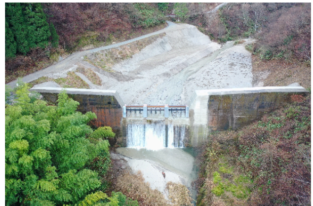
殿又谷第1砂防堰堤 施工完了(2022年12月)