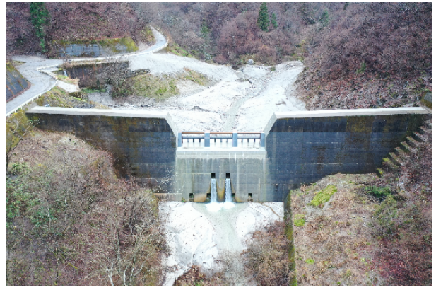
殿又谷第2砂防堰堤 施工完了(2022年12月)