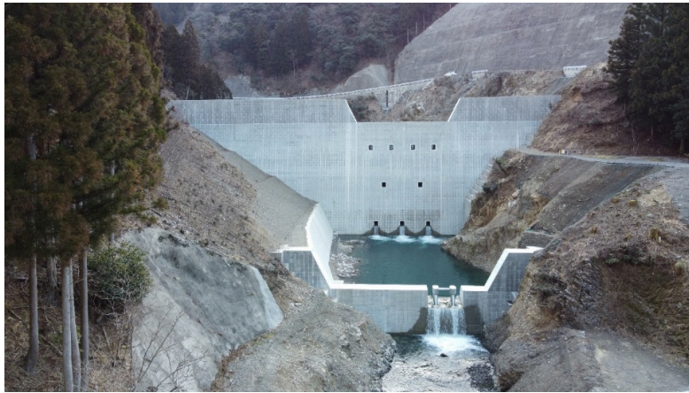
高地谷第1砂防堰堤